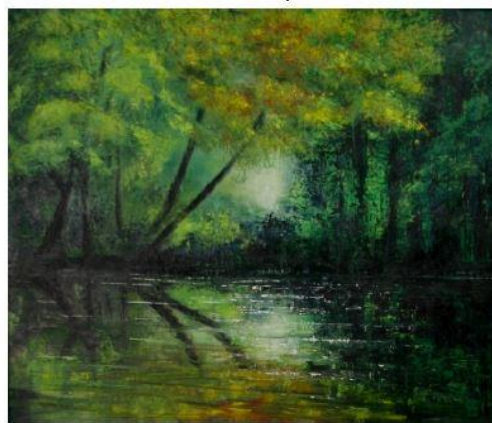
U vody, 2012

Velice miluji přírodu, takže tento námět se nejčastěji objevuje v mých obrazech. Nezobrazuji však přírodu fotograficky, ale snažím se hlavně vyjádřit určitou náladu nebo pocity. Ráda experimentuji, zkouším různé malířské techniky.