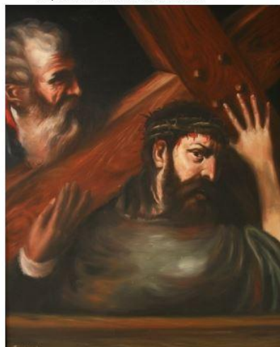
Christ Carrying the Cross (kopie originálu Tiziano Vecellio)