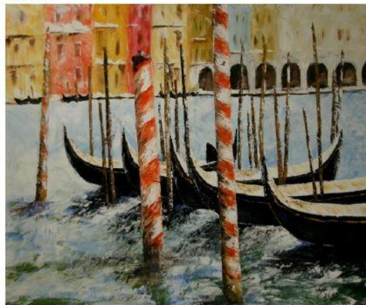
Lodky v Benátkách, 2013

Narodil jsem se v Přerově, značnou část svého mládí jsem prožil v oblasti Jeseníků. Sám se neřadím k žádnému výtvarnému směru. Na obrazech mi jde především o zachycení atmosféry místa. Velmi obdivuji práce starých mistrů, duchovní díla jsou mi často inspirací.