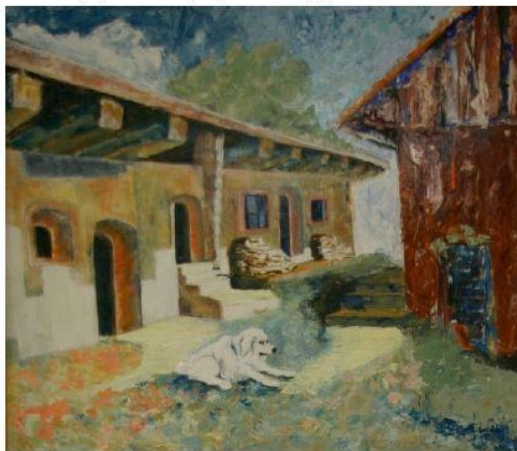
Detvianske lazy, 2009

Mojim rodiskom a pôsobiskom je Bratislava.