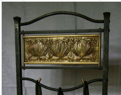
Krbové náčiní (detail)

Věnuji se výtvarnému zpracování kovů (tepané reliéfy, drobné plastiky, šperky). Pokusy s olejomalbou jsou pro mě oddechovkou.